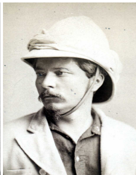
H.M. Stanley 1841-1904

Durante muchos siglos, la empresa colonial fue transparente: un país, aprovechándose de su fuerza, invadía a otro más débil, se apoderaba de él y lo saqueaba. Nadie ponía en cuestión semejante estado de cosas porque se trataba de algo que se venía practicando desde la noche de los tiempos y todos, colonizadores y colonizados, aceptaban o se resignaban a esta cruda realidad como a una fatalidad inevitable, consustancial a la historia.